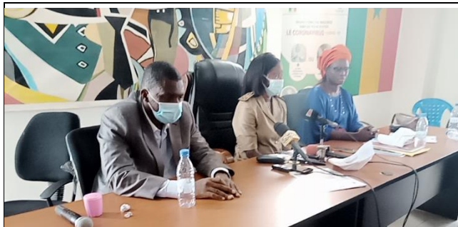
Gouverneur coordonnateur Pipadhs et DG ANPECTP