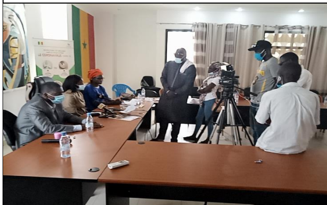
Point de presse Gouverneur, Coordonnateur et DG ANPECTP