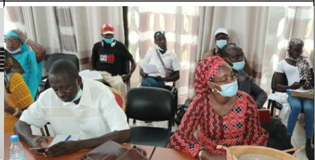
Membres du CRD