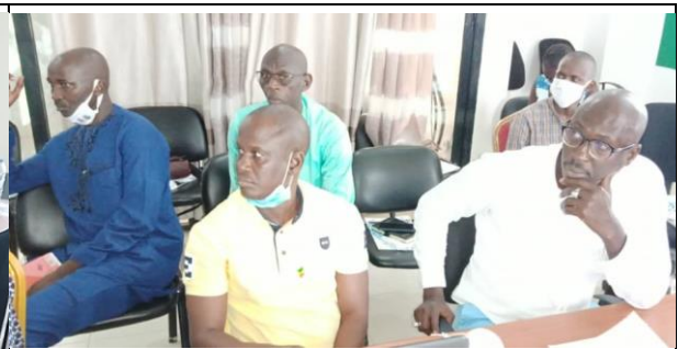
Membres CRD Fatick