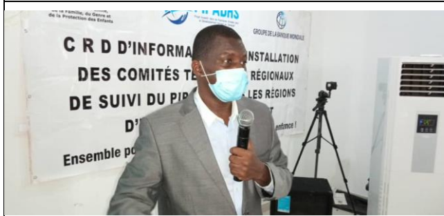
Présentation PIPADHS par le coordonnateur