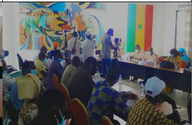
vu de la salle du CRD de Fatick