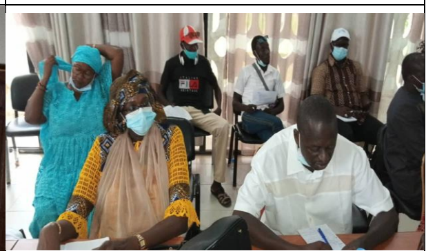
Membres du CRD